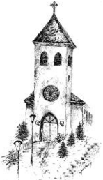
St. Johannes Ev. Gernsdorf