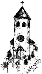
St. Johannes Ev Gernsdorf