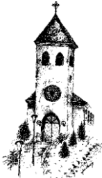
St. Johannes Ev Gernsdorf