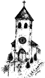
St. Johannes Ev Gernsdorf