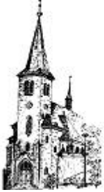
St. Laurentius Rudersdorf