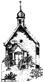
St. Antonius Anzhausen

Der nächste Pfarrbrief erscheint vom 01.04. bis 30.04.2017. Red.-Schluss Donnerstag, 16.03.2017 !!!