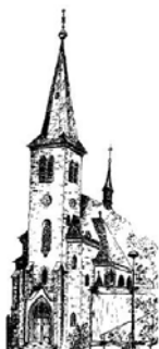
St. Laurentius Rudersdorf

Redaktionsschluß: 20.10.2016 um 11.00 Uhr