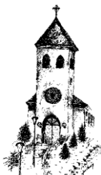
St. Johannes Ev Gernsdorf