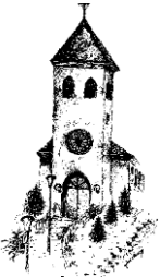
St. Johannes Ev Gernsdorf