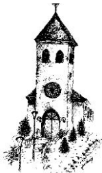
St. Johannes Ev Gernsdorf