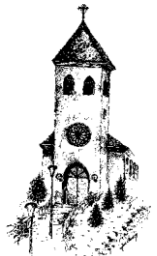
St. Johannes Ev Gernsdorf