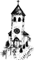
St. Johannes Ev Gernsdorf