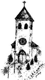
St. Johannes Ev Gernsdorf