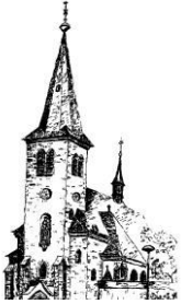
St. Laurentius Rudersdorf

Redaktionsschluß: 17.09.2015 um 11.00 Uhr