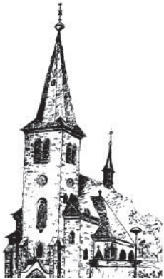
St. Laurentius Rudersdorf