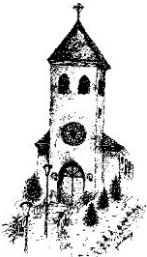
St. Johannes Ev Gernsdorf