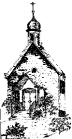
St. Antonius Anzhausen