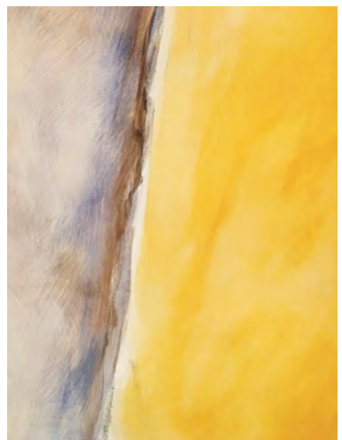
Detail/ Ausschnitte der freien Malerei Chor Wand St. Johannes Evangelist zu Gernsdorf